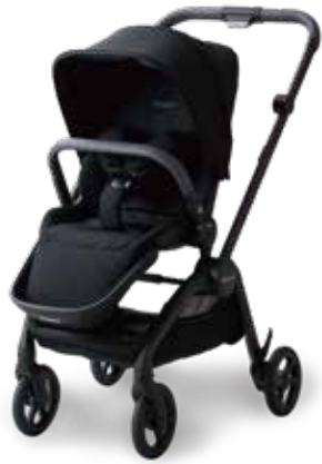
サデナ ストローラーセット (フレーム+シートユニット)

メーカー希望小売価格 83,600円 (税込価格) (RK6601.21000.07)