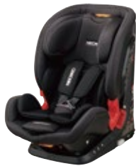
J1 Duo Plus ジェイワンデュオ プラス (サムライブラック) (00089038540080)