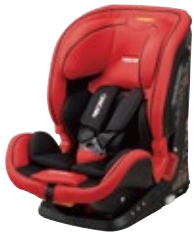
J1 Duo Plus ジェイワンデュオ プラス (クレナイレッド) (00089038530080)